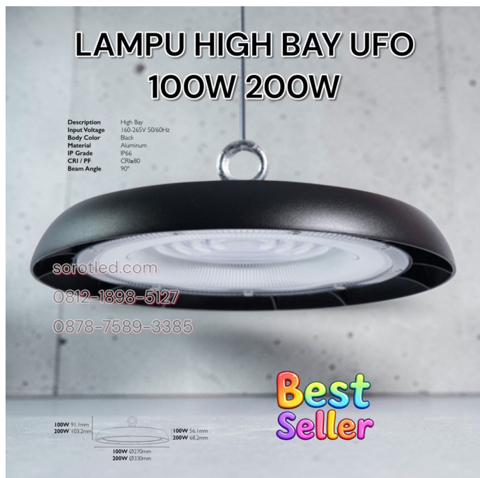
Lampu Gantung UFO 100W 200W LED IP66